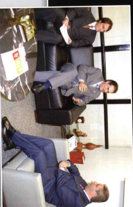
Ouidores entregam convite ao governador Antonio Anastasia